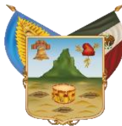
Estado Libre y Soberano de Hidalgo